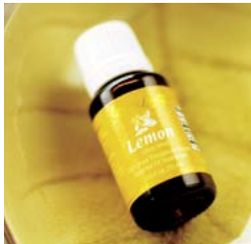
ZITRONE ARTIKELNUMMER 3578 15ML

WARNHINWEIS: ZITRONENÖL DARF NICHT AUF HAUTSTELLEN ANGEWENDET WERDEN, DIE IN DEN NÄCHSTEN 12 STUNDEN DIREKTER SONNENEINSTRALHUNG BZW. ULTRAVIOLETTER STRALHUNG AUSGESETZT SEIN WERDEN.